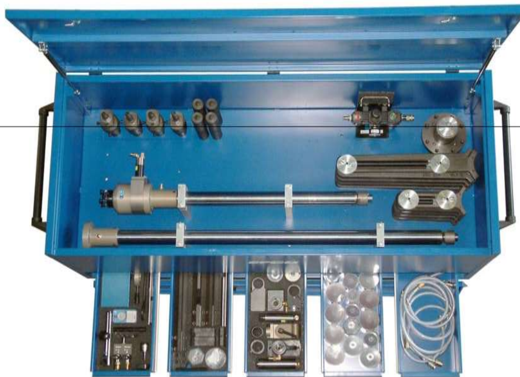
VSA به همراه جعبه ابزار کارگاهی

Otto-Brenner-Straße 5 – 7 • D - 52353 Düren • Phone: +49-(0)2421-989-0 • Fax: +49-(0)2421-86260 info@efco-dueren.de □ sales@efco-dueren.de □ www.efco-dueren.com Agencies in many countries