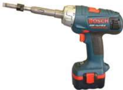
VALVA با باتری قابل شارژ