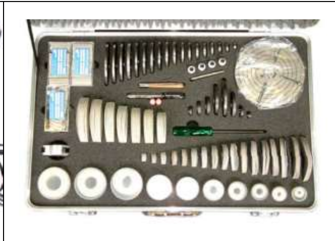
VALVA-1 متعلقات و کیف