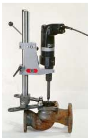
VALVA-1 با استند