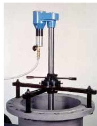
سیستم گیره سه نقطه مرکز VALVA-2