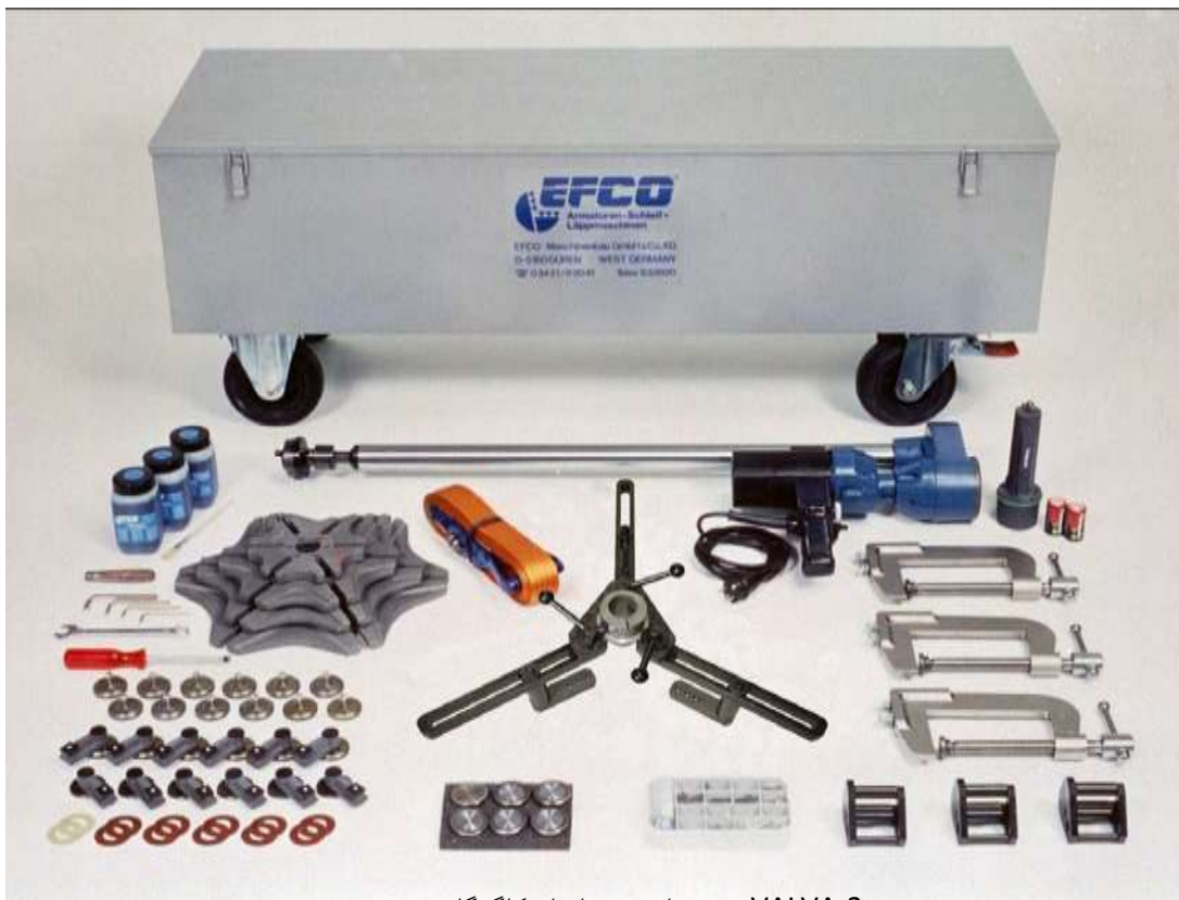
VALVA-2 به همراه جعبه ابزار کابردگاهی مخصوص