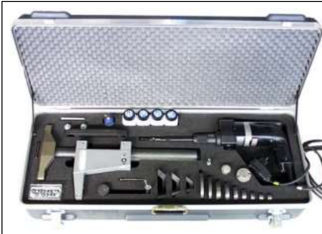
VALVA-1 دستگاه و کیف

ماشین آلات VALVA به مانند تمامی محصولات EFCO در یک ست کامل ابزار تعمیرات ارایه میشوند .