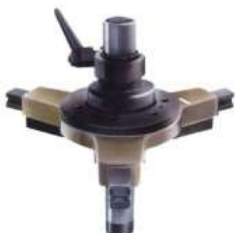
سه نظام با لوله ریل (گاید)