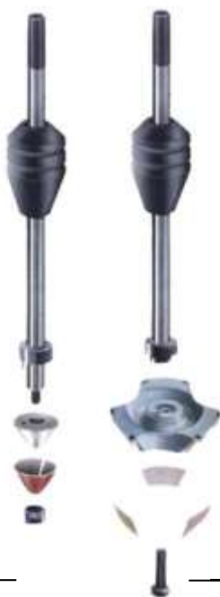
مخروط (مرغک) مرکز (سنتر)